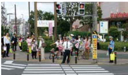
大和綾瀬交通安全協会 イトーヨーカ堂前における 自転車キャンペーン