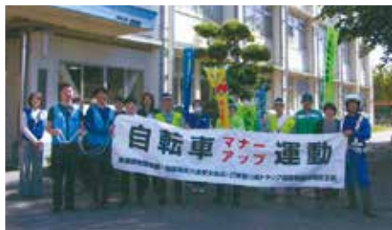
相模原南交通安全協会 麻溝台高校における 自転車キャンペーン