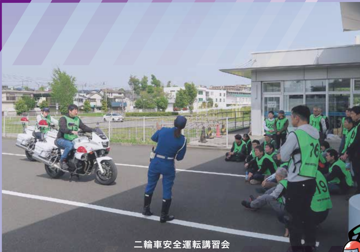
二輪車安全運転講習会

かながわバイクリカレントスクール セーフティライダーズスクール・ベーシックライディングレッスン 皆さんの参加をお待ちしております!