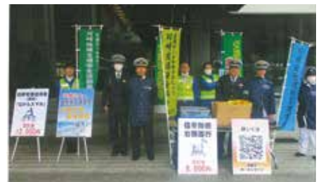
川崎交通安全協会 川崎市役所前における 自転車キャンペーン