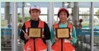
植田特別指導員 北小路特別指導員