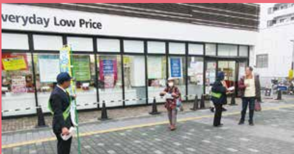
藤沢北 湘南台駅前における違法駐車追放キャンペーン