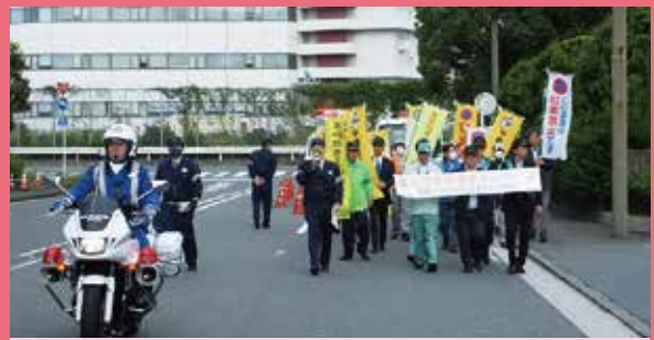
川崎臨港 東扇島周辺における違法駐車追放キャンペーン