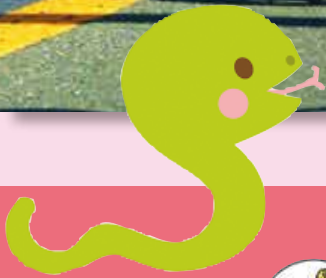
(箱根駅伝)