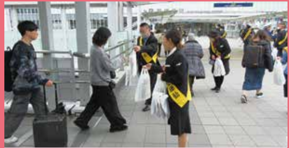
港北 新横浜駅前における神奈川県バス協会合同交通安全キャンペーン