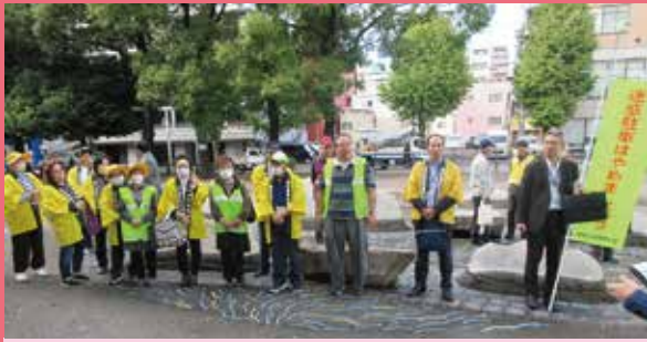
南・伊勢佐木 大通り公園周辺における違法駐車追放キャンペーン