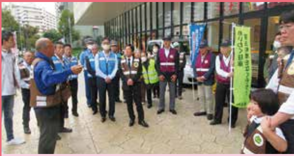
保土ヶ谷 イオン天王町店前における違法駐車追放キャンペーン