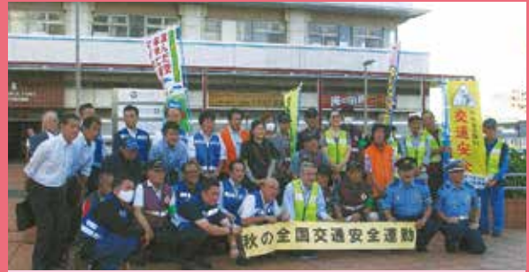
神奈川 東神奈川駅前における秋の全国交通安全運動キャンペーン