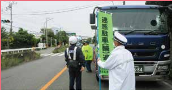
山手 本牧埠頭における違法駐車追放キャンペーン