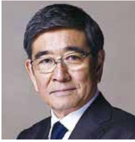
公益財団法人 神奈川県交通安全協会 会長 石坂 浩二