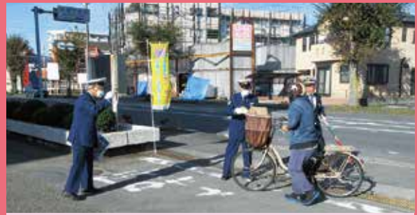
座間 警察署前における放置自転車追放キャンペーン